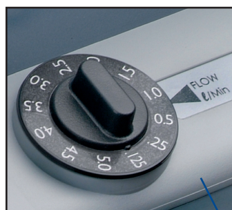
Selector de caudal con sistema de bloqueo